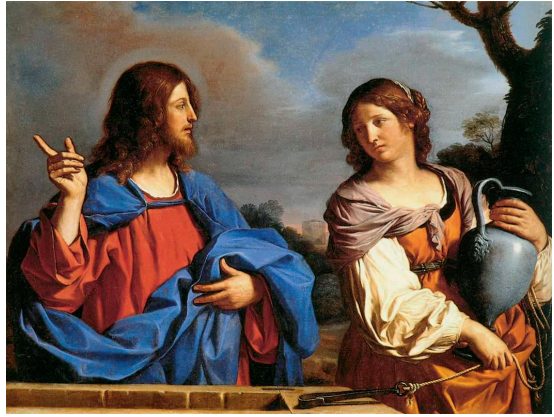
Джованни Барбьери. Иисус и самарянка у колодца. 1640

ибо таких поклонников Отец ищет Себе. Бог есть дух, и поклоняющиеся Ему должны поклоняться в духе и истине» (Ин. 4:23,24). Христос представил отличительные черты истинных Его последователей: они будут подобны Ему в характере и духовном состоянии и будут придерживаться истин Слова Божия: «Если пребудете в слове Моем, то вы истинно Мои ученики» (Ин. 8:31). Обращаясь к Небесному Отцу, Христос просит за учеников: «Освяти их истиною Твоею: слово Твое есть истина» (Ин. 17:17).