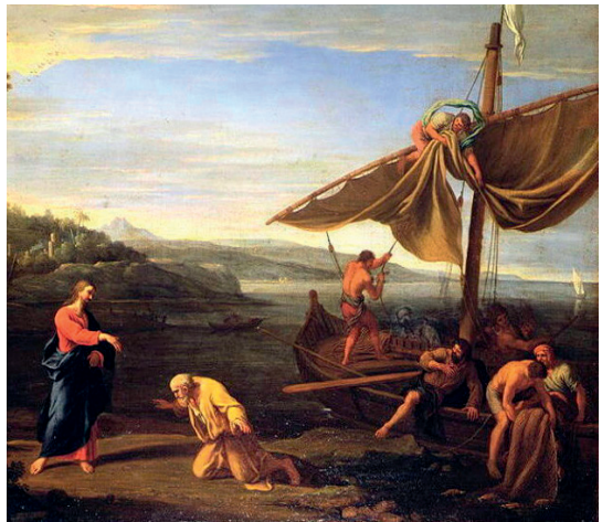
Филипп де Шампень. Призвание Петра

Христос призывал Своих последователей: «...кто хочет идти за Мною, отвергнись себя, и возьми крест свой, и следуй за Мною» (Мар.8:34). Вот как, например, описан отклик Симона и Андрея на призыв Христа: «Проходя же близ моря Галилейского, увидел Симона и Андрея, брата его, закидывающих сети в море, ибо они были рыболовы. И сказал им Иисус: идите за Мною, и Я сделаю, что вы будете ловцами человеков. И они тотчас, оставив свои сети, последовали за Ним»