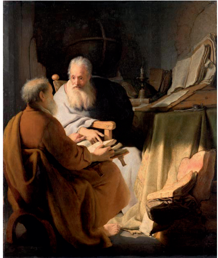
Рембрандт. Размышление апостолов Павла и Петра над Священным Писанием. 1628

Священное Писание призывает нас придерживаться исключительно «благовествования Христова» (Фил. 1:27) и не идти на компромисс с человеческими традициями. Правда принадлежит не большинству, она принадлежит только Богу. Апостол Павел говорит: «Хотя бы сыны Израилевы были числом, как песок морской, только остаток спасется» (Рим. 9:27).