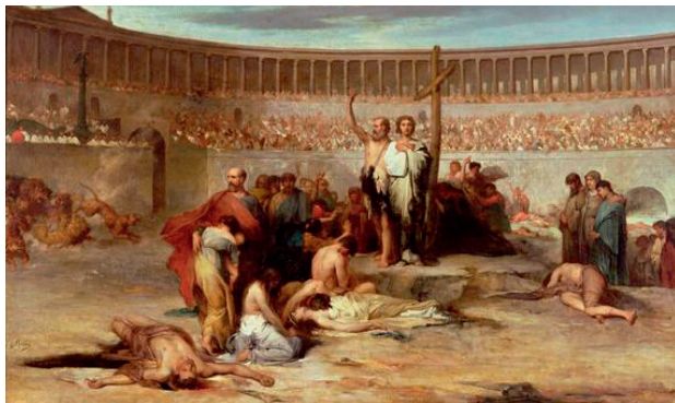
Эжен-Ромен Тиршон. Триумф веры. Христианские мученики