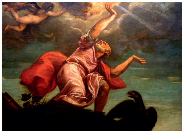
Тициан. Божественное откровение Иоанну на острове Патмос. 1544

Апостол Иоанн получил это видение, когда находился в ссылке на острове Патмос за веру во Христа. Иоанн хорошо знал ветхозаветные образы и понял, что речь идет об отступившей Церкви. Когда он осознал, что Церковь, ныне гонимая, сама будет проливать кровь верных Библейскому учению последователей Иисуса, он едва мог в это поверить: «Я видел, что жена (Вавилон) упоена была кровью святых и кровью свидетелей Иисусовых, и, видя ее, дивился удивлением великим» (Откр. 17:6). История свидетельствует, что от рук церковной инквизиции, предназначенной для борьбы с любым инакомыслием, в средние века погибло больше христиан,