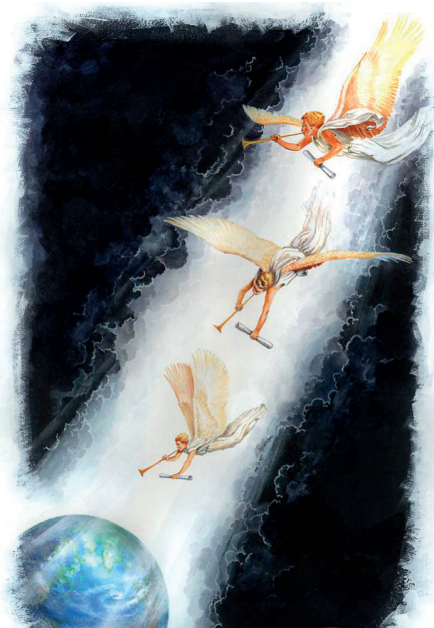
«...земля осветилась от славы его» (Откр. 18:1)

благовествовать живущим на земле, и всякому племени, и колену, и языку, и народу» (Откр. 14:6); «После сего я увидел иного Ангела, сходящего с неба и имеющего власть великую; земля осветилась от славы его» (Откр. 18:1).