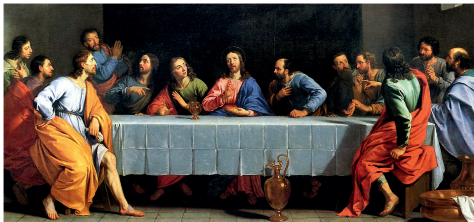
Филипп де Шампень. Христос и Его ученики в Верхней Горнице. 1648

Христос определенно заявляет, что не считает Своей Церковью то общество людей, которые называют себя именем Христа, но «делают беззаконие», то есть не чтят те или иные заповеди Закона Божия. О