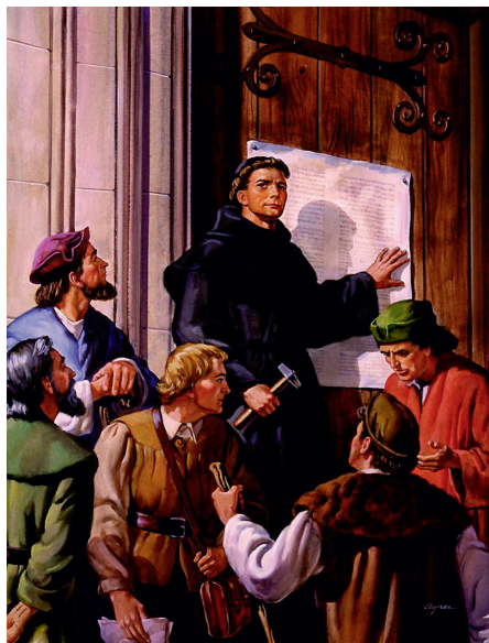
Лютер в знак протеста прибывает к дверям церкви Виттенберга 95 тезисов

Выйти из Вавилона означает также отказаться от греховного образа жизни. Апостол Павел призывал: «Что общего у света с тьмою?.. Ибо вы - храм Бога живого, как сказал Бог: вселюсь в них и буду ходить в них; и буду их Богом, и они будут Моим народом. И потому выйдите из среды их и отделитесь, говорит Господь, и не прикасайтесь к нечистому; и Я приму вас» (2 Кор. 6:14-17).