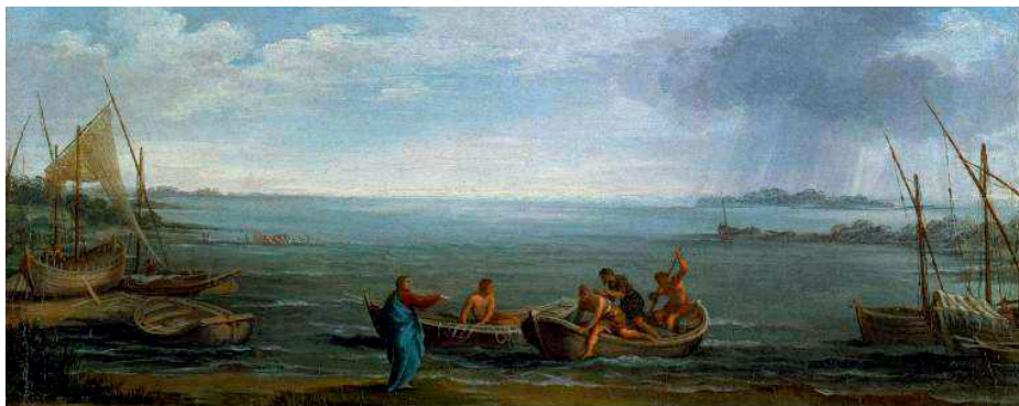
Пьетро да Кортона. Следуй за Мной

Если вы желаете найти истинную Церковь, Господь ясно указал ее отличительные черты. Христос сказал: «Кто хочет творить волю Его, тот узнает о сем учении, от Бога ли оно...» (Ин. 7:17) . Желаете ли вы быть в числе истинных последователей Христа, «сохраняющих заповеди Божии и имеющих свидетельство Иисуса»?