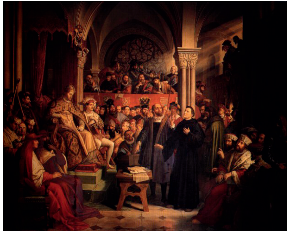
Юлиус Шнорр фон Карольсфельд. Лютер на сейме в Вормсе. 1869

Протестантская реформация вернула народу Библию и многие утра-