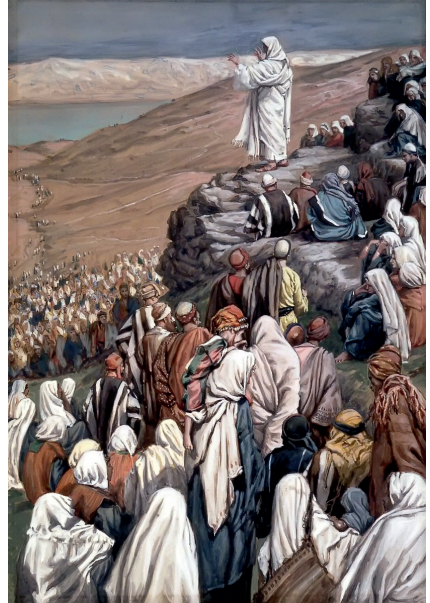
Джеймс Тиссо. Нагорная проповедь. 1886

Иоанн Креститель говорит о Христе: «Тот, Которого послал Бог, говорит слова Божии...» (Ин. 3:34) . Провозвестие Иисуса было ничем иным как Словом Божиим. Следовательно, выражения «слово Божие» и «свидетельство Иисуса»