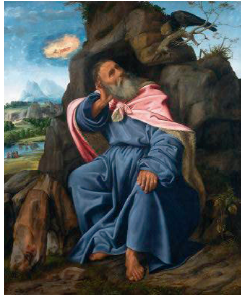
Савольдо Джироламо. Пророк Илия, скрывающийся от преследований. 1510

Греческое слово «лойпос» («прочие») дословно означает «оставшиеся, остальные». В ветхозаветное время «оставшимися» или «остатком» называли израильтян, которые выживали после войны, разрушений или других катаклизмов, а также тех, кто во время испытаний оставались верными Богу. Во времена пророка Илии Израиль впал в идолопоклонство. Пророк, который бесстрашно обличал царя Ахава, виновного в расцвете идолопоклонства в стране, вынужден был скрываться от преследований. Илия в отчаянии взывал к Богу: «Возревновал я о Господе, Боге Саваофе, ибо сыны Израилевы оставили завет Твой, разрушили жертвенники Твои и пророков Твоих убили мечом; остался я один,