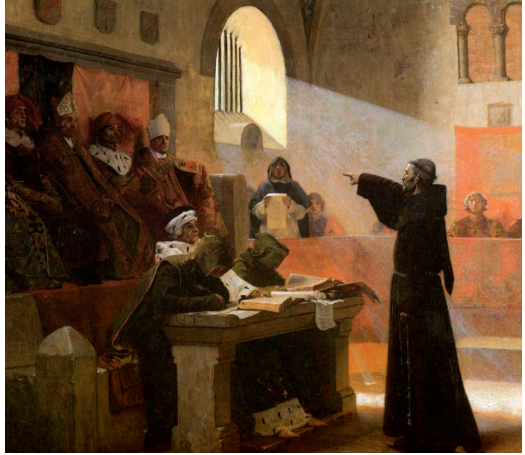
Жан-Поль Лоран. Трибунал инквизиции. 1906

Господь описывает Церковь в послеапостольский период как блудницу, указывая на ее неверность завету и идолопоклонство: «Вавилон, великая блудница, сделался жилищем бесов и пристанищем всякому нечистому духу... яростным вином блудодеяния своего она напоила все народы» (Откр. 18:2). Опьяняющая чаша, которую она преподносит миру, символизирует ложные учения, противоречащие Слову Божьему.