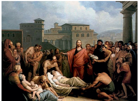
Маттье ван Бре. Исцеление Христом больных

Ученые исследовали влияние религиозности на здоровье человека. Среди верующих оказалось меньше тех, кто страдает от сердечных приступов, закупорки вен, высокого кровяного давления и других заболеваний. Жизнь верующего человека более полнокровна, потому что он менее подвержен депрессивному состоянию. В чем заключается секрет