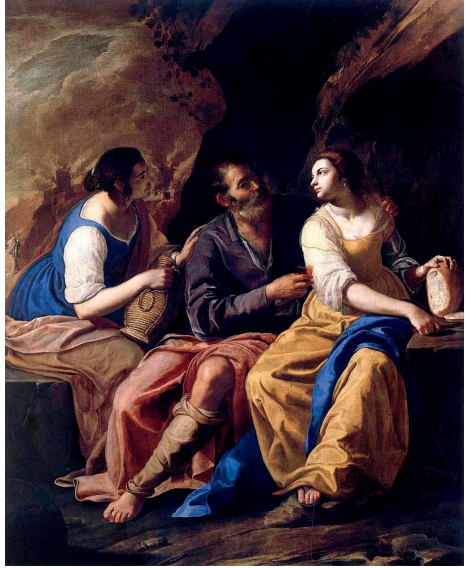
Артемизия Джентилески. Лот и его дочери.

опьянения лежал больной. Напоив Лота, дочери имели близость со своим отцом, после этого женщины забеременели, от них произошли два народа, которые враждовали с евреями, а затем исчезли с арены истории. Самсон, назорей Божий, пристрастившись к вину, уступил обольщениям негодной женщины. Навал, что значит «безумный», из-за пристрастия к вину попал в беду. Амнон, один из сыновей царя Давида, напившись, изнасиловал свою сестру Фамарь. Эти и другие люди оказались в таком положении, потому что пренебрегли ясными указаниями Бога. Пророк Исаия пишет, что от вина порой не воздерживались даже священники и пророки: «Шатаются от вина и сбиваются с пути от сикеры; священник и пророк спотыкаются от крепких напитков; побеждены вином, обезумели от сикеры, в видении ошибаются, в суждении спотыкаются» (Ис. 28:7).