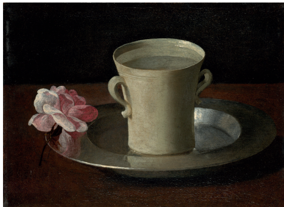
Франсиско де Сурбаран. Чашка с водой. 1630

продукты теряют свои полезные свойства и приобретают качества, которые, наоборот, разрушают наше здоровье. В поисках способов продлить сроки хранения продуктов и улучшить вкусовые качества блюд люди изобрели рафинированные продукты – очищенную муку (более полезную муку с отрубями сложнее хранить), гидрогенизированные жиры (в т.ч. маргарин), полированный рис, зерновые хлопья, пищевые добавки, красители и консерванты. Люди, которые питаются исключительно рафинированными продуктами и фастфудами, приобретают заболевания пищеварительной и сердечнососудистой систем. Поэтому рекомендуется употреблять хлеб из муки грубого помола, вместо шлифованного белого риса – неочищенный, вместо сливочного масла – оливковое, вместо сладостей – фрукты и овощи.