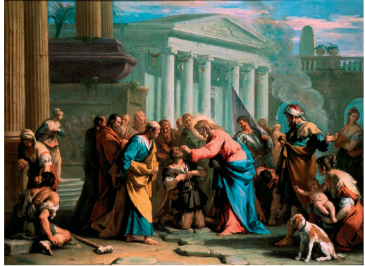
Себастьяно Риччи. Исцеление слепого. 1715

что вы - храм Божий, и Дух Божий живет в вас? Если кто разорит храм Божий, того покарает Бог: ибо храм Божий свят; а этот храм - вы» (1 Кор. 3:16,17). Жизнь, которая была дарована Творцом, есть великое богатство, которое нельзя бездумно расточать. Бог желает, чтобы жизнь людей была счастливой, полноценной и долгой. Человек подотчетен Богу за то, как относится к своему здоровью: он не может безнаказанно осквернять или разрушать свое тело.