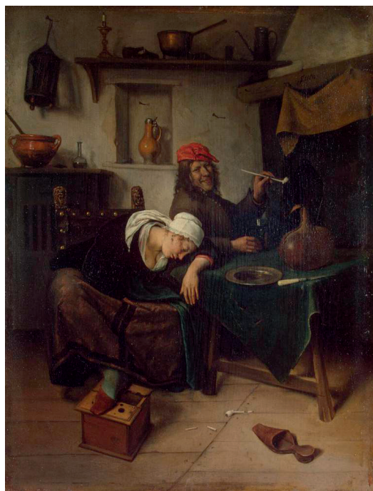
Ян Стен. Пьяницы. 1660

Первая часть 18-го текста 5-й главы Послания к Ефесянам предупреждает: «Не становитесь пьяными от вина, которое ведет к распутству». Апостол Павел употребление вина в любых количествах рассматривает как зло,