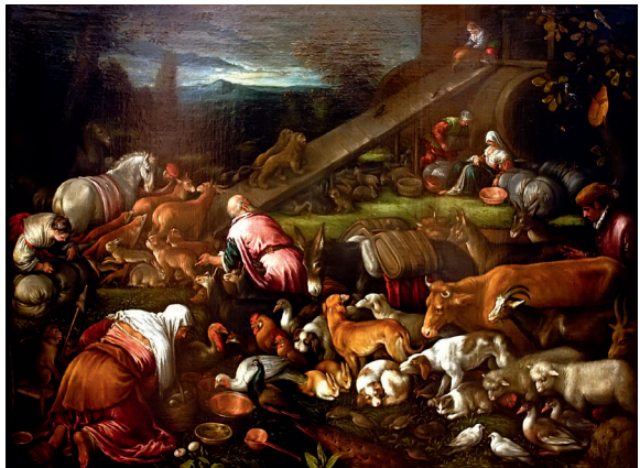
Франческо Бассано. Вхождение животных в Ноев ковчег. 1670

Можно услышать заявления, что, поскольку эти запреты являются частью левитского закона, который теперь отменен, они не имеют особого значения для христиан. Напомним, что знание о чистых и нечистых