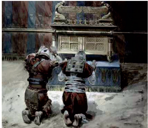
Джеймс Тиссо. Моисей и Аарон во святилище

Священники не только сами должны были руководствоваться данным принципом, но, по