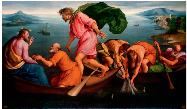
Якопо Бассано. Чудесный улов учеников, доверившихся слову Господа. 1545

Господь Бог оставил нам обетование: «Не бойся, ибо Я с тобою; не смущайся, ибо Я Бог твой; Я укреплю тебя, и помогу тебе, и поддержу тебя десницею правды Моей» (Ис. 41:10). Доверие Божественной силе – ключ к хорошему здоровью и счастливой жизни.