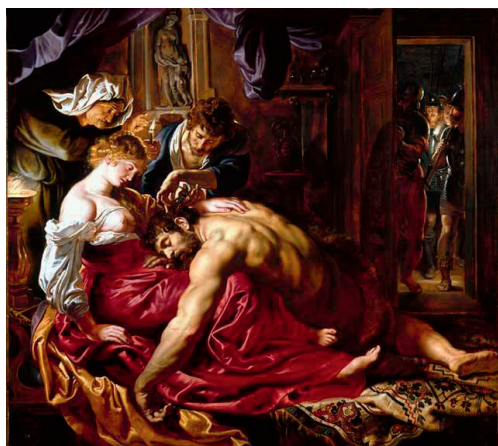
Питер Рубенс. Самсон и Далида. 1609

Господь через пророков и учителей Израиля неоднократно выражал Свое мнение по поводу употребления алкогольных напитков. В своих притчах царь Соломон предупреждает: «Не смотри на вино, как оно краснеет, как оно искрится в чаше, как оно ухаживается ровно: впоследствии, как змей, оно укусит, и ужалит, как аспид; глаза твои будут смотреть на чужих жен, и сердце твое заговорит развратное, и ты будешь, как спящий среди моря и как спящий на верху мачты. И скажешь: “били меня, мне не было больно; толкали меня, я не чувствовал. Когда проснусь, опять буду искать того же”» (Притч. 23:31-35) . Употребление алкогольных напитков делает человека морально