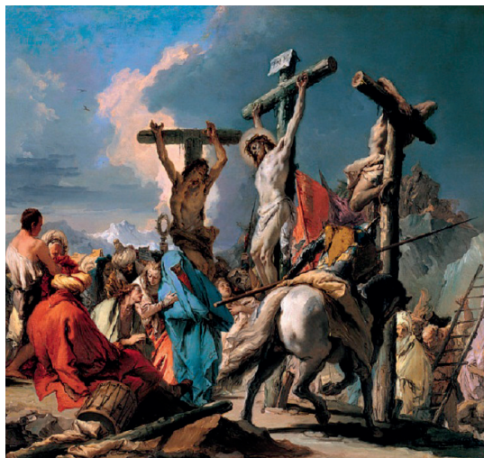
Джованни Тьеполо. Распятие. 1745-1750

Священное Писание называет тело человека храмом Святого Духа (см. 1 Кор. 6:19). Ценность человеческой жизни подчеркивает апостол Павел в 1-м Послании к Коринфянам: «Не знаете ли, что тела ваши суть храм живущего в вас Святого Духа, Которого имеете вы от Бога, и вы не свои? Ибо вы куплены дорогою ценою. Посему прославляйте Бога и в телах ваших» (1 Кор. 6:19,20). Каждый человек сотворен Богом и