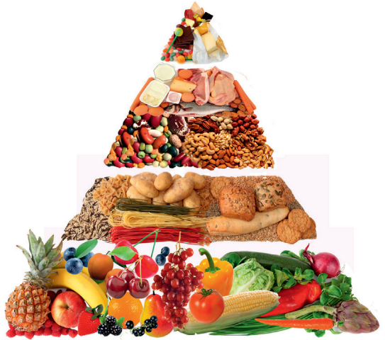
Пирамида здорового питания

Здоровье зависит от правильного сбалансированного питания. Специалисты разработали пирамиду здорового питания. Фундамент пирамиды питания составляют овощи, зелень и фрукты – важный источник витаминов и минералов. На втором уровне располагаются зерновые продукты с высоким содержанием клетчатки – хлеб с отрубями, макаронные изделия из твердых сортов пшеницы, неочищенный рис, каши из цельных зерен, а также картофель. Эти «сложные углеводы» способны утолять аппетит при меньшем количестве калорий. Углеводы – это «горючее» нашего организма. Но нам нужны «сложные углеводы», которые усваиваются медленнее, чем сахар. Они содержатся в картофеле, злаковых, хлебе и иных продуктах из муки грубого помола.