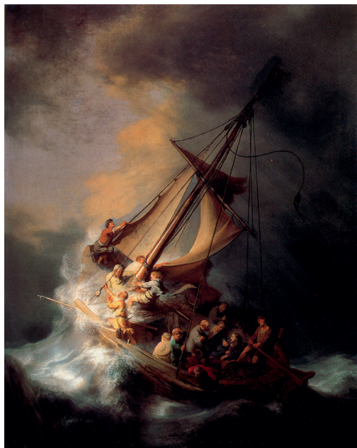
Рембрандт. Укрощение бури Христом. 1633

Священное Писание гласит: «Все заботы ваши возложите на Него, ибо Он печется о вас» (1 Петр. 5:7).