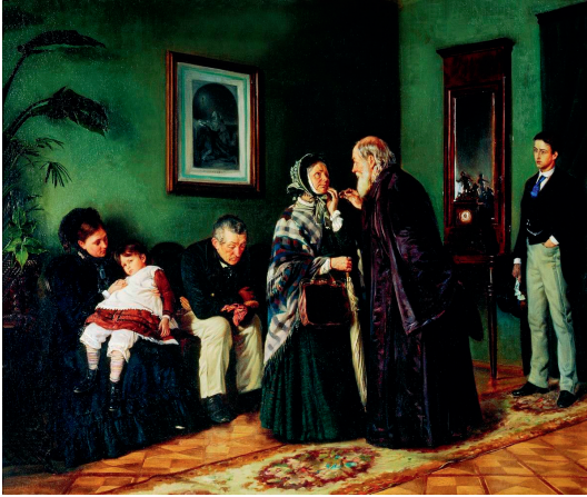
В.Е. Маковский. В приемной у доктора. 1870

постоянная работа. В нашем организме заложен огромный потенциал не только для полноценной жизни, но и для восстановления в случае утраты здоровья. Медицина сегодня обладает множеством возможностей для восстановления здоровья, но намного разумнее, да и значительно дешевле постараться сохранить свое здоровье, прежде чем понадобится какое-либо вмешательство извне. И первым