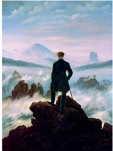
К.Д. Фридрих. Странник над морем тумана (символ неизвестного будущего). 1818

Считается, что «человек силен идти куда вздумается. Считается, будто он свободен». Однако это не так – в какой-то момент неизбежность смерти перерезает все невидимые нити, которыми