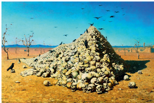
В. В. Верещагин. Анофеоз войны. 1871

в различных регионах мира составил от 50 до 60 процентов! Терракты происходят в среднем один раз в два дня, причем раз от раза теракты становятся все более жестокими. Число жертв растет.