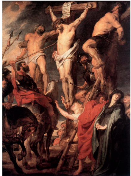
П. Рубенс. Христос на кресте. 1610-1611

Мы можем быть уверены в том, что Второе пришествие Христа непременно произойдет, потому что у нас есть обетование Христа, заверившего нас о Своем возвращении: «Небо и прейдут, но слова Мои не прейдут» (Мф. 24:35) . Первое явление в наш мир Христа, Его страдания и смерть на Голгофском кресте были бы лишены всякого смысла, если бы Иисус не обещал возвратиться. Весь план спасения – этот сложный и долгий путь, невероятно высокая его цена заключаются в том, чтобы вернуть человеку утраченный рай, чтобы человек снова мог увидеть лик Бога. Поэтому Христос непременно возвратится ради завершения искупительного служения, начатого при Его