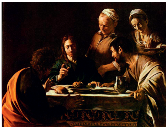
Караваджо. Христос в Эммаусе. 1606

После того, как Иисус заверил Своих учеников в том, что Он придет в наш мир во второй раз, «приступили к Нему ученики наедине и спросили: скажи нам, когда это будет? и какой признак Твоего пришествия и кончины века?» (Мф. 24:3).