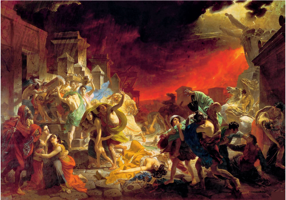
Карл Брюллов. Последний день Помпеи. 1833

Через несколько недель после цунами серия ураганов принесла смерть в центральную Америку и Соединенные Штаты. Ураган «Катрина» унес жизни 1836 жителей, экономический ущерб составил 81,2 млрд. долл., разрушен