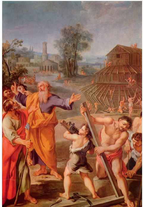
Анонимный французский мастер. Строительство Ноева ковчега. ок.1675

Времена Ноя связаны с событиями всемирного потопа, а времена Лота – с уничтожением городов Содома и Гоморры, печально известными своей развращенностью. Другими словами, это два периода в истории древнего мира, когда люди были уничтожены за свои беззакония. То есть, когда Христос говорил о различных видах жизнедеятельности в эти периоды, главное в словах Христа не то, что люди делали, а то, чего они не понимали, делая все это. Написано, что они «перед потопом ели, пили, женились и выходили замуж... и не думали, пока не пришел потоп и не истребил всех,